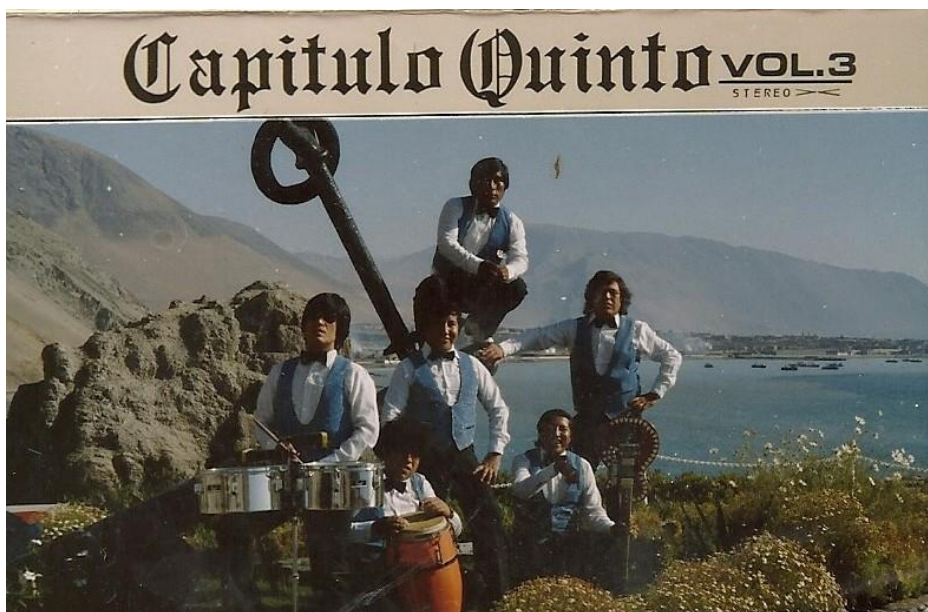
Imagen 2: Volumen número 3 de la agrupación Capítulo Quinto en el sector del “Marinero desconocido” en Iquique.

Ahora, en el campo del repertorio Capítulo Quinto se concentró en covers y en composiciones propias. Por ejemplo, en el Volumen 3 (ver imagen n° 2), se incluyen canciones de Pachuco y la Cubanacan –“El Africano” o “El Negro”–, Rodolfo Aicardi –“Enamorado”, o como se nombró dentro de la caratula, “Estabas Engañada”–, Lorenzo Palacios Quispe –“Gaviota”–, Cuarteto Continental –“Tormento”– y Agua Marina –“Ay no se puede” y “La Revancha”–.